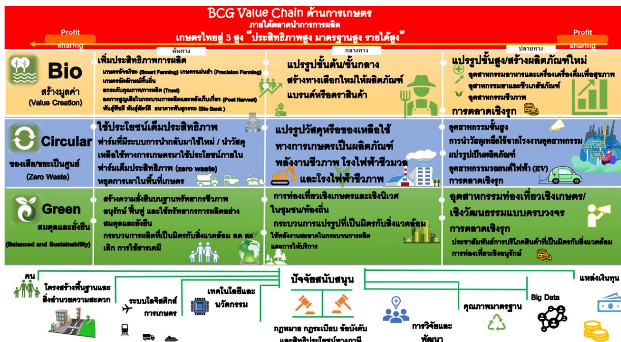
ภาพที่ 2 โซ่คุณค่า (Value chain) ของ BCG Model ด้านการเกษตร

โดยมีปัจจัยสนับสนุนเศรษฐกิจในแต่ละด้าน ได้แก่ คน โครงสร้างพื้นฐานและสิ่งอำนวยความสะดวก ระบบโลจิสติกส์การเกษตร เทคโนโลยีและนวัตกรรม กฎหมาย ระเบียบ ข้อบังคับ และสิทธิประโยชน์ทางภาษี การวิจัยและพัฒนา คุณภาพและมาตรฐาน Big Data และแหล่งเงินทุน